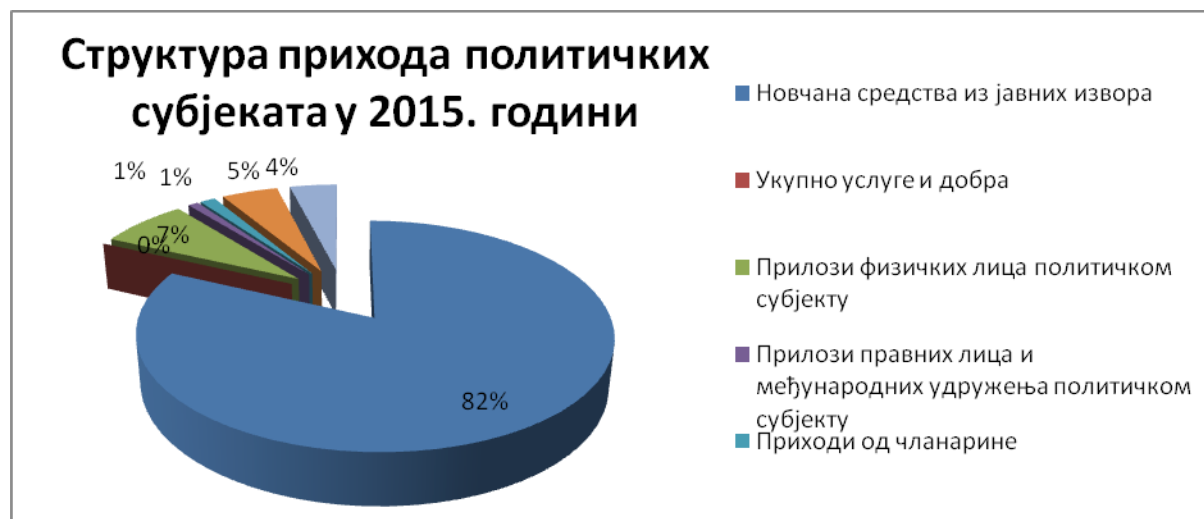
Графикон 2.1. Структура укупних прихода политичких субјеката у 2015. години